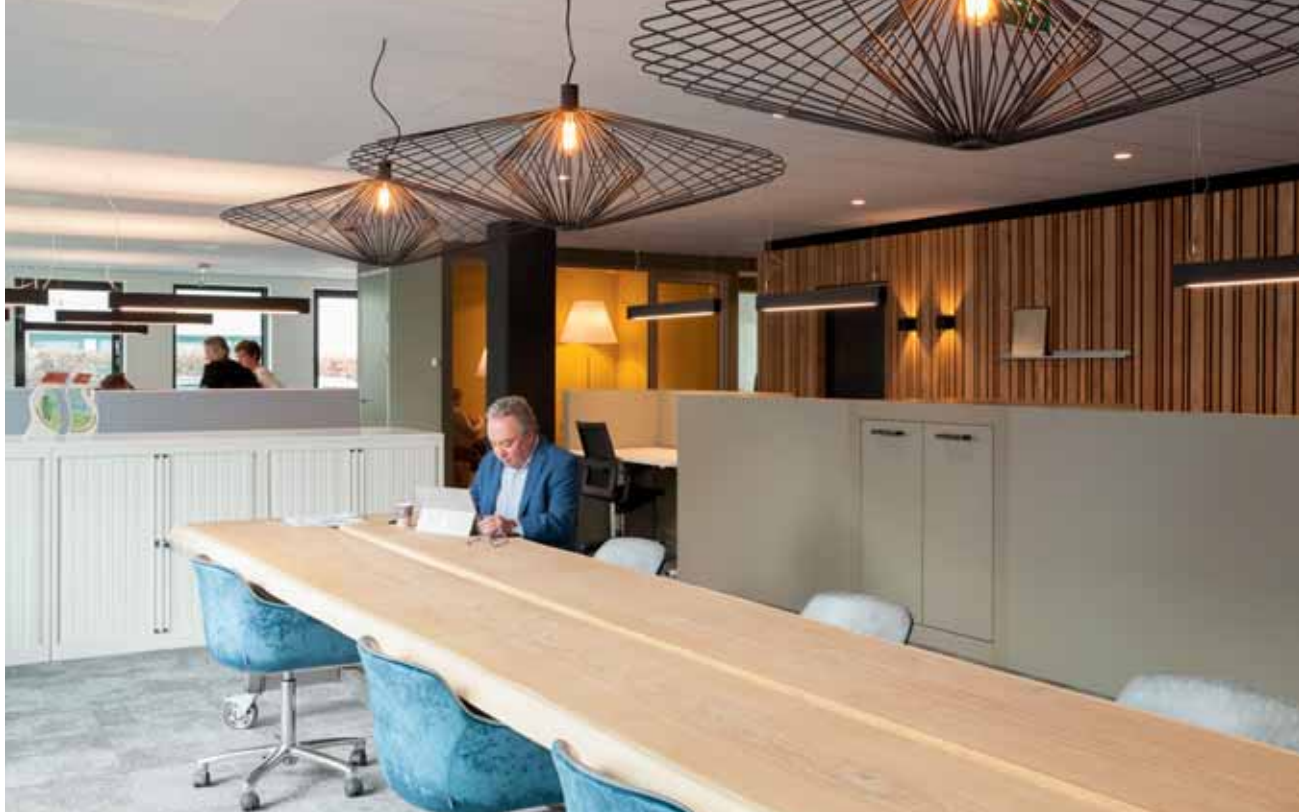
FOTO BOVEN De tafel in het werkgebied die wordt gebruikt als aanlandplek.